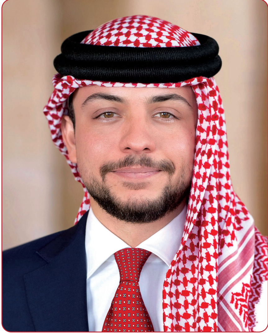
صاحب السمو الملكي الأمير حسين بن عبد الله الثاني ولي العهد المعظم