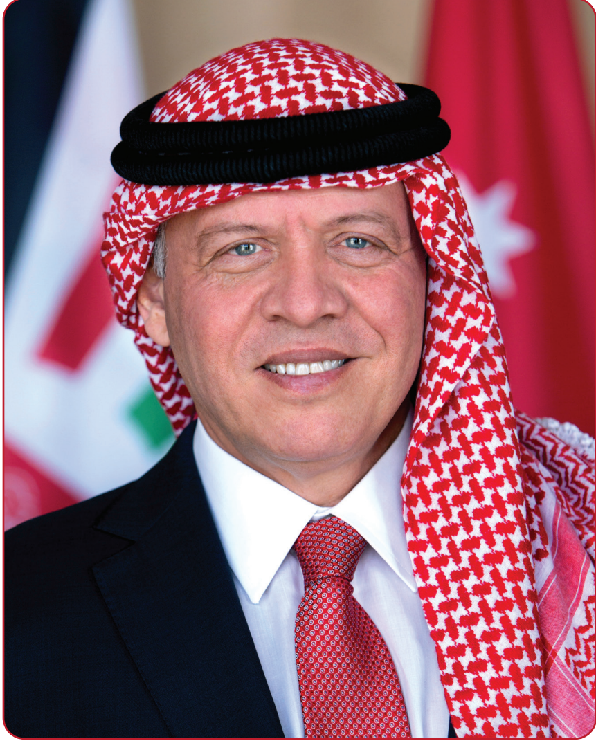
حضرة صاحب الجلالة الهاشمية الملك عبد الله الثاني ابن الحسين المعظم